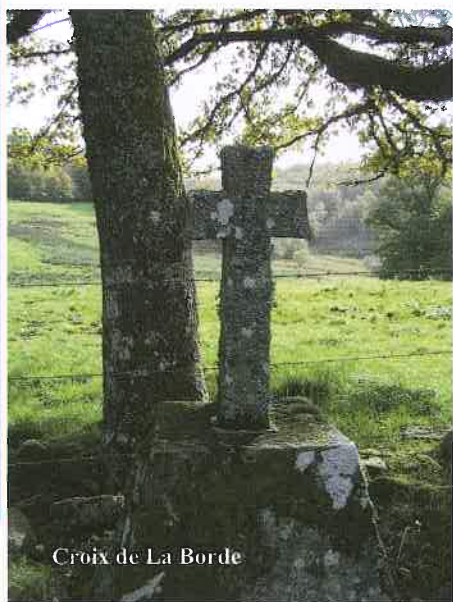
Croix de La Borde

copyright IGN -SCAN 25 LE C619 - 011 carte 1:25 000 - Peyrelevade 2232E