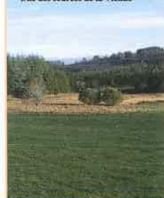
Une des sources de la Vienne

A LA DECOUVERTE DES SOURCES DE LA VIENNE Un circuit de découverte des sources de la Vienne au départ de Millevaches devrait voir le jour en 2009