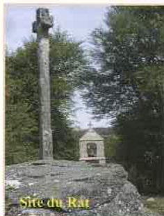
Site du Rat